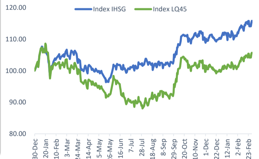
Index Movement (Base: 2021)