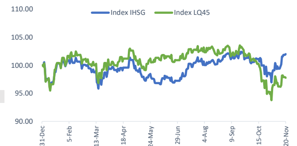
Index Movement 2023 (year to date)