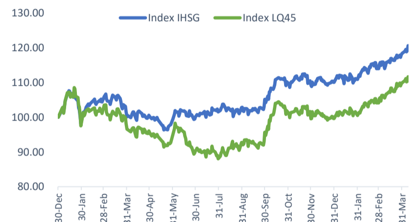
Index Movement (Base: 2020)